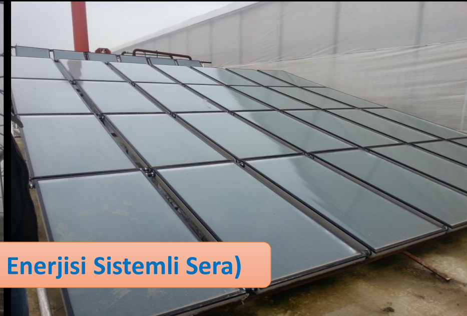
Fide Üretim Tesisi (Güneş Enerjisi Sistemli Sera)