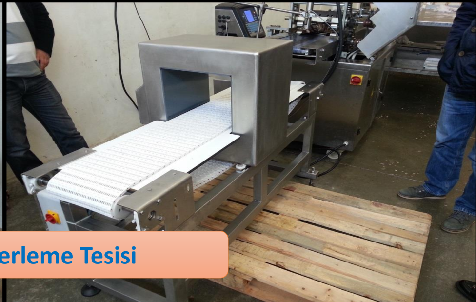
Helva ve Şekerleme Tesisi