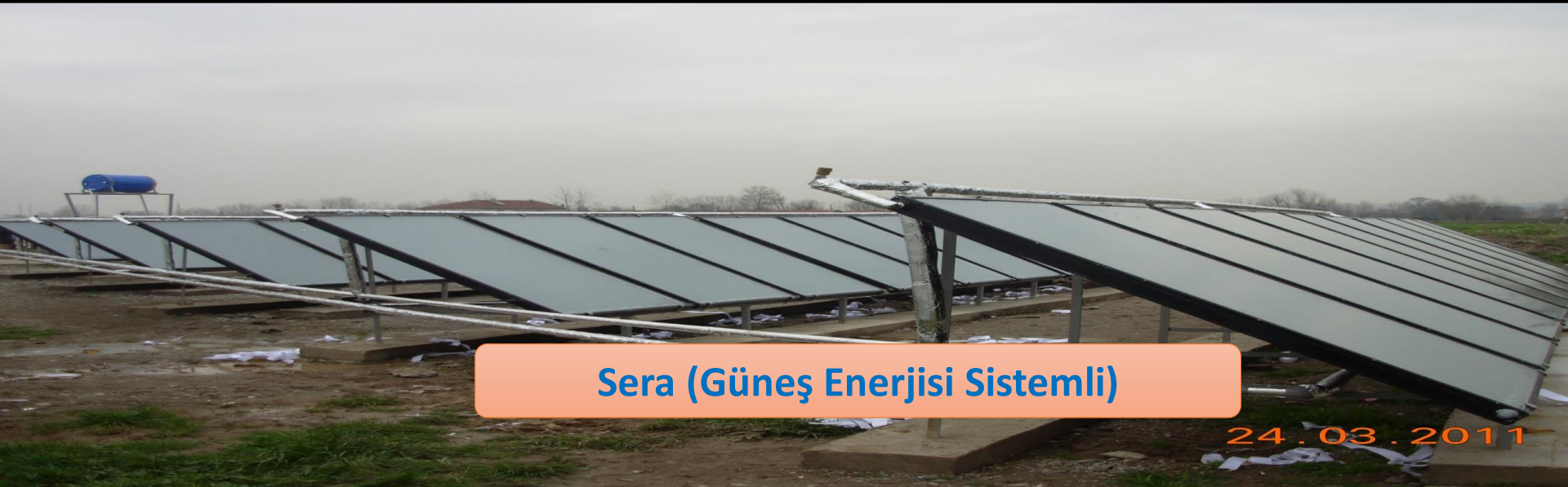
Sera (Güneş Enerjisi Sistemli)