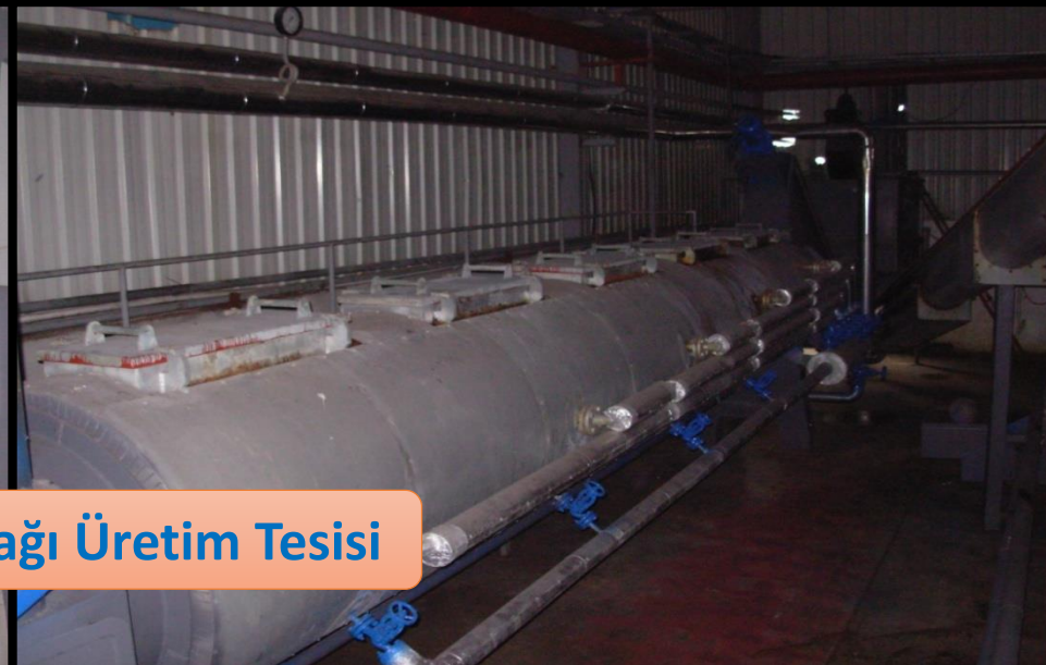
Balık Unu ve Yağı Üretim Tesisi