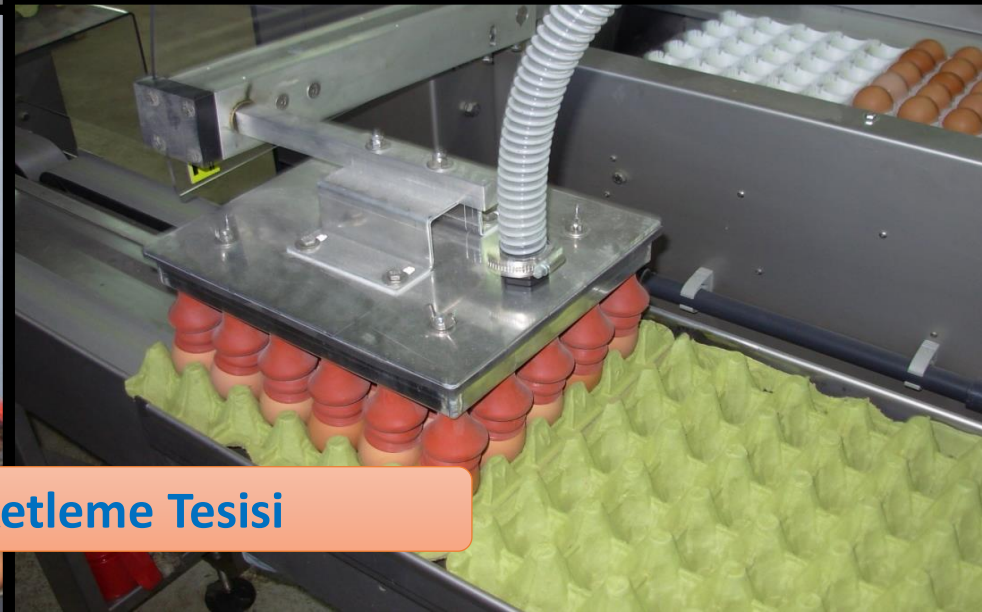
Yumurta Paketleme Tesisi