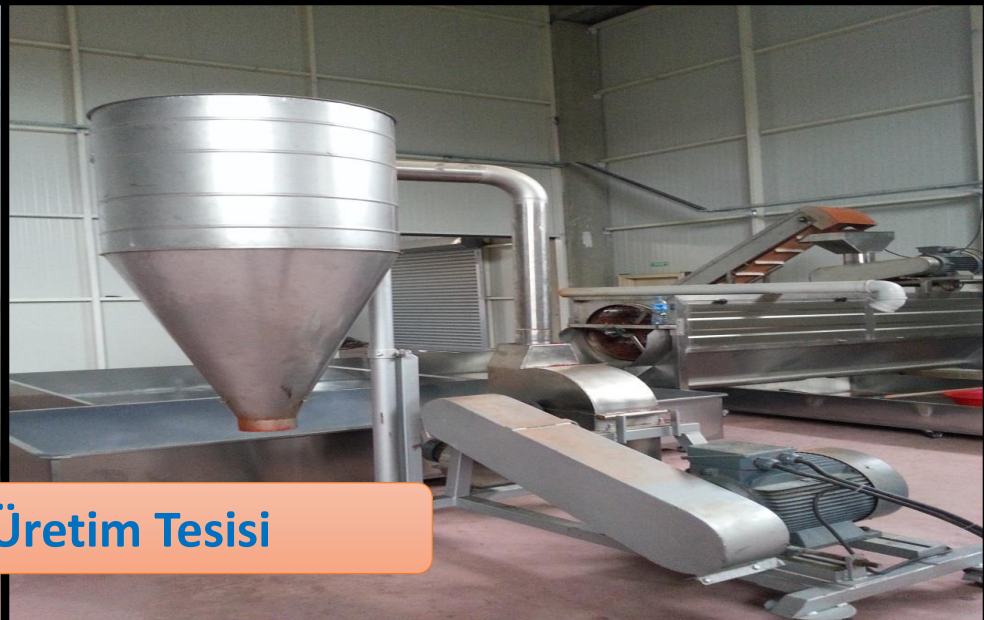
Pul Biber Üretim Tesisi