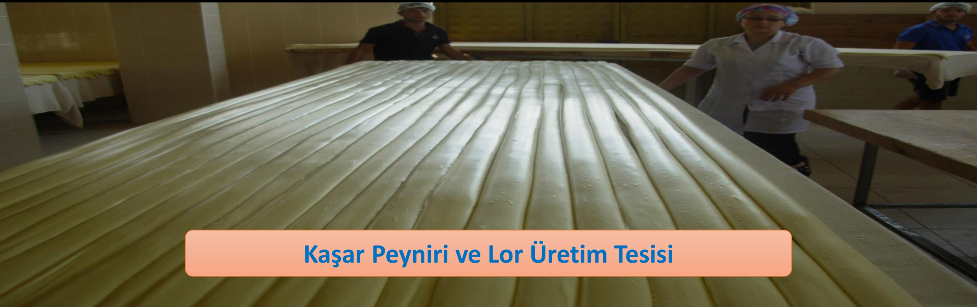
Kaşar Peyniri ve Lor Üretim Tesisi