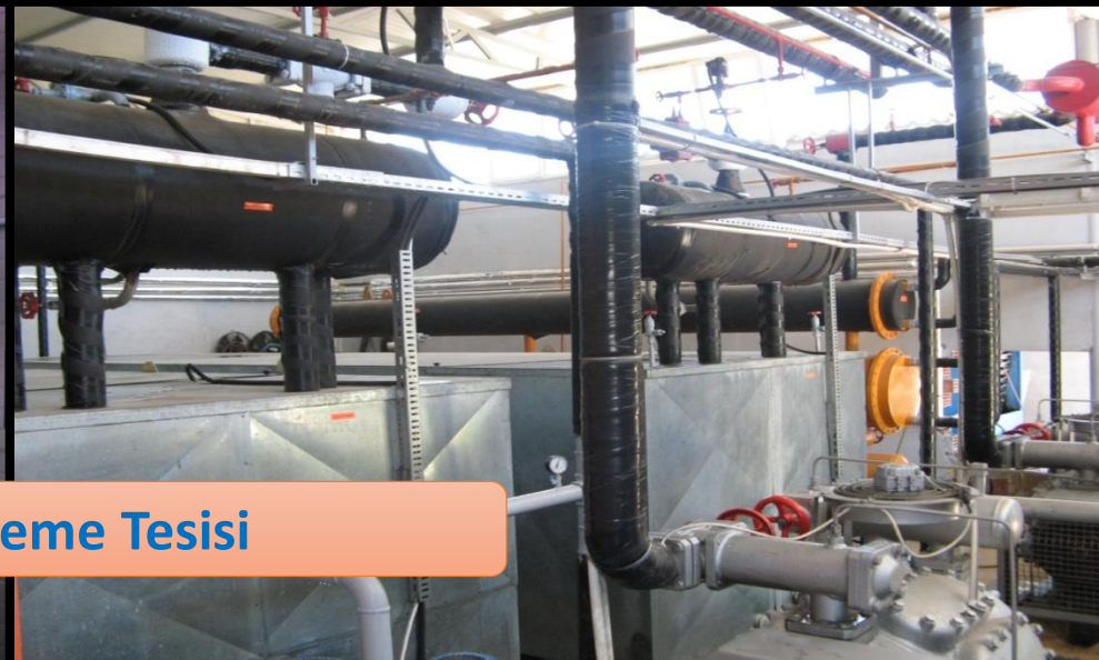
Süt İşleme Tesisi