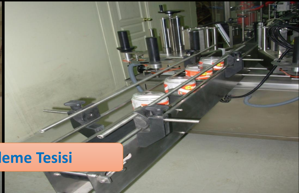
Fındık İşleme Tesisi