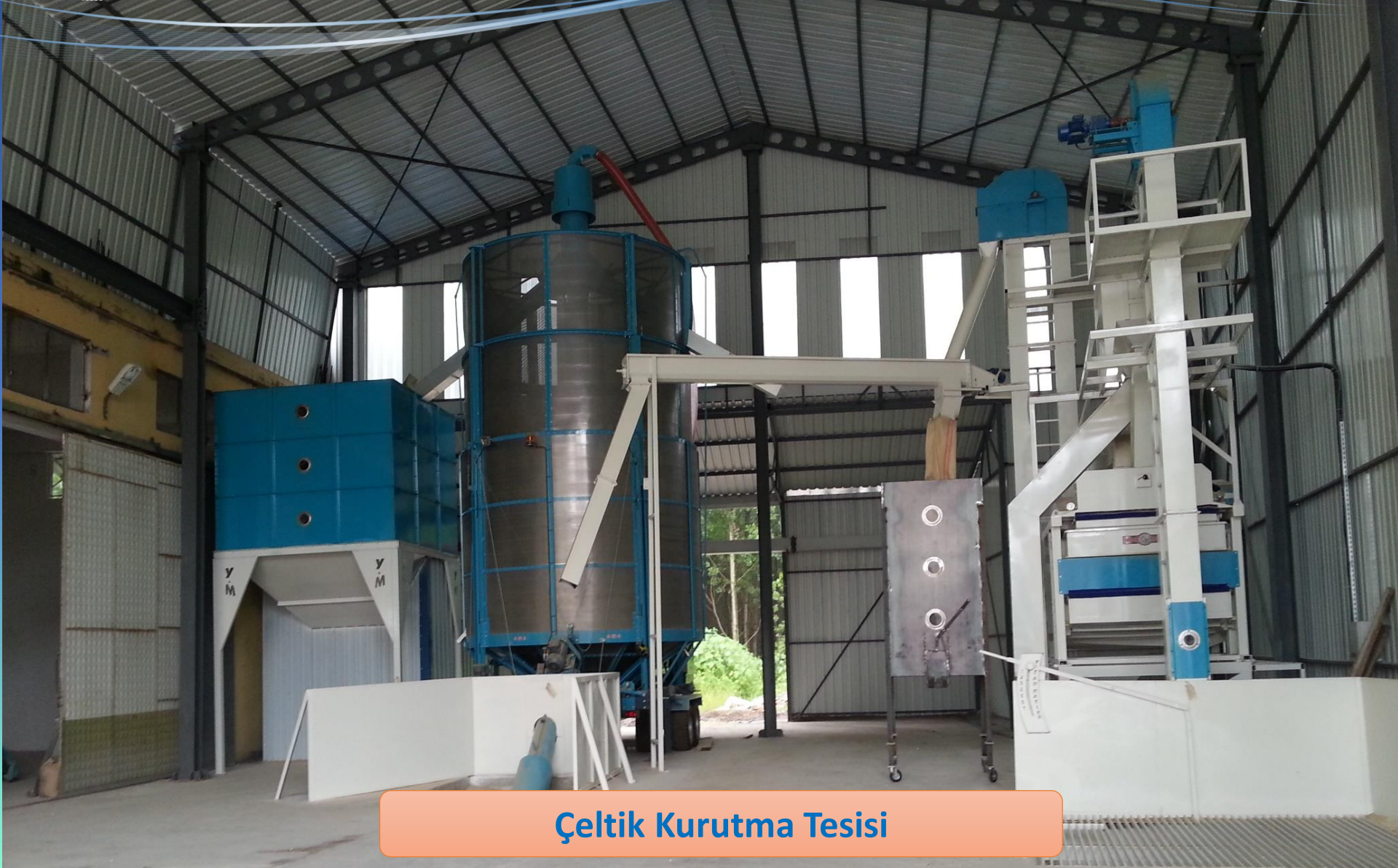
Çeltik Kurutma Tesisi