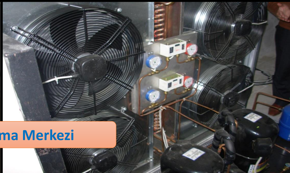
Süt Toplama Merkezi