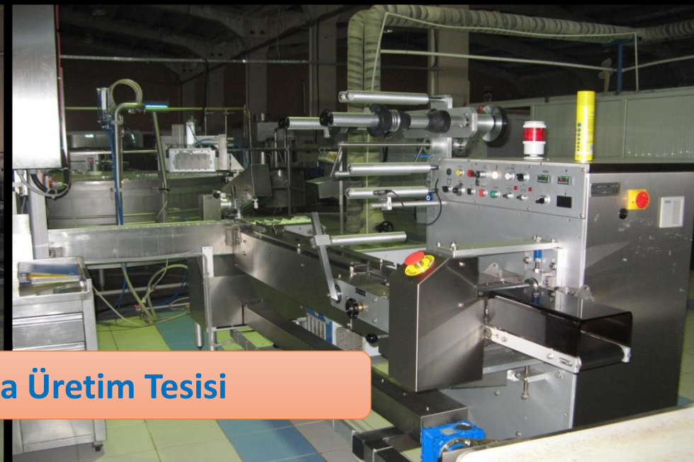
Dondurma Üretim Tesisi